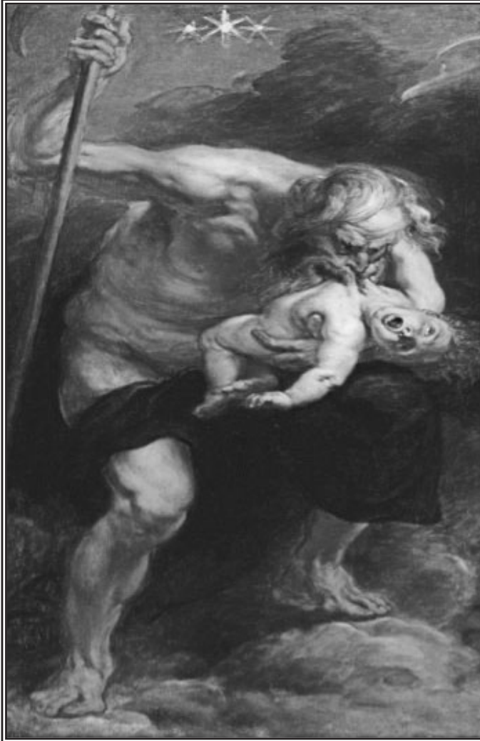
Rubens, Pedro Pablo. Saturno devorando a un hijo, 1636-1638.